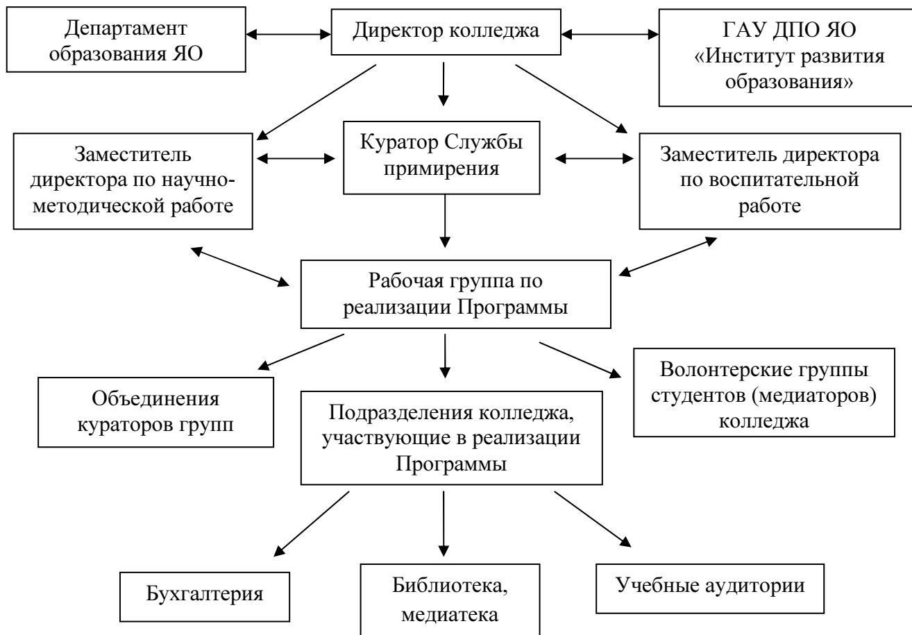
Схема 2. Механизм взаимодействия участников реализуемой Программы